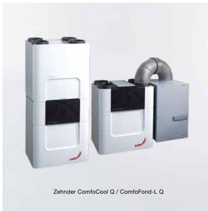
Zehnder ComfoCool Q / ComfoFond-L Q

Perfektní řešení všech požadavků s kompletním systémem Zehnder doplněným o volitelné příslušenství