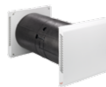
Zehnder ComfoSpot 50