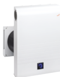
Zehnder ComfoAir 70